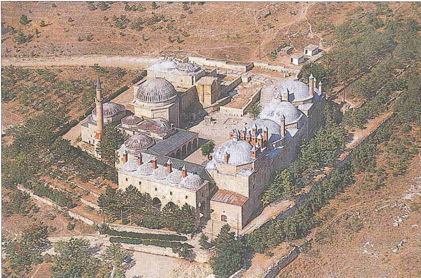
Seyyid Battal Gazî Külliyesi'nin kuşbakışı görünüşü – Eskişehir