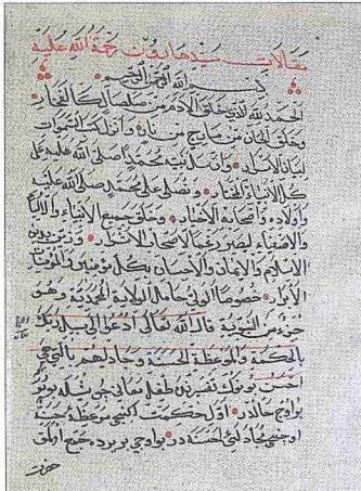
Makâlât-i Seyyid Hârûn 'un ilk iki sayfası (Manisa İl Halk Ktp., nr. 1390)