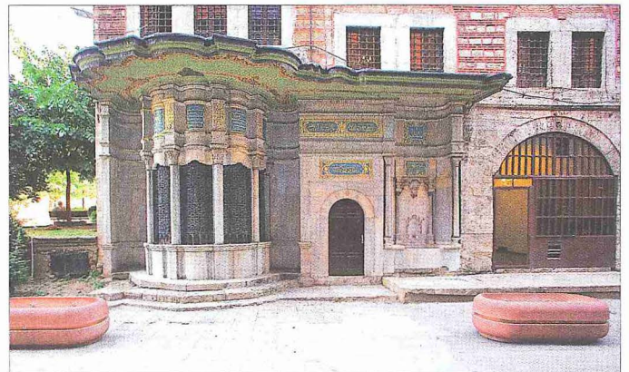
Seyyid Hasan Paşa Çeşme ve Sebîli - Beyazıt / İstanbul