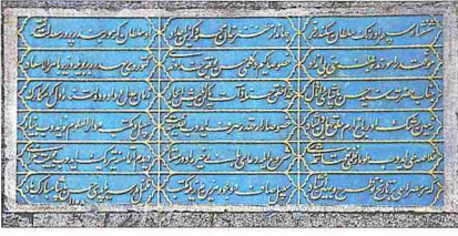
Seyyid Hasan Paşa Külliyesi'nin kapısı üzerindeki kitâbe

açılmaktadır. Bu kapı ve pencerelerin çoğunun üzeri sivri kemerli alınlıklı olup içlik denilen camlarla dekorlanmıştır. Odaların dışı açılan pencereleri vardır. Kuzeydoğu köşesinde yer alan ve helâ olarak düzenlenmiş olan dikdörtgen planlı birim kuzey ve doğu yönünde iki kare pencereye sahip aynalı tonozla örtülmüştür. Avluda var olduğu bilinen şadırvan günümüze ulaşmamıştır. 1892'de tamir gören medresenin 1914 yılında şadırvan, çamaşırhane, gusülhâne ve abdesthanelerinde tamire ihtiyaç duyulduğu yapılan teftiş heyeti raporunda belirlenmiştir. 1949 yılında Ekrem Hakkı Ayverdi tarafından esaslı bir onarım geçiren yapıda avlunun güney yönündeki üç pencere açılmıştır. Daha sonra 1990'da tekrar tamir gören yapı şimdi İstanbul Üniversitesi Avrasya Araştırmaları Enstitüsü olarak faaliyetini sürdürmektedir.