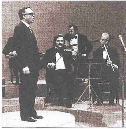
Bekir Sıtkı Sezgin Ankara'da bir televizyon konserinde (26 Mart 1975)

Klasik müzik, tasavvuf ve Mevlvî müzikisi repertuarı çerçevesinde yurt içinde ve Almanya, Belçika, Fransa, Hollanda, İtalya, İngiltere, İspanya, Japonya gibi ülkelerde her biri başlı başına bir sanat hadisesi olarak nitelendirilen pek çok konser vermiştir. 1978'de Sheraton Oteli Salonu'nda verdiği konser İstanbul'daki ilk konseridir. 1981 yılında Topkapı Sarayı Müzesi Bâ-