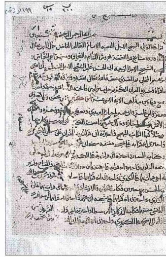
Sibtu'l-Hayyât'ın el-Mübhic adlı eserinin unvan sayfasıyla ilk sayfası (Millet Ktp., Feyzullah Efendi, nr. 10)

29 Şâban 464'te (21 Mayıs 1072) Bağdat'ta doğdu. Anne tarafından dedesi Şeyhülislâm Ebû Mansûr Muhammed b. Ahmed b. Ali el-Hayyât'a nisbetle Sibtu'l-Hayyât diye meşhur oldu. Kendisinden büyük olan kardeşi kıraat âlimi Ebû Abdullâh Hüseyin b. Ali de aynı lakapla anılmıştır. Abdullâh ilimle uğraşan bir aile ortamında yetişti. Ebû'l-Hüseyn İbnü'n-Nakûr, Ebû Mansûr Muhammed b. Muhammed el-Ukberî, Tîrâd ez-Zeynebî ve Sâbit b. Bûndâr'dan hadis dinledi. Başta dedesi Ebû Mansûr el-Hayyât olmak üzere Şerîf Abdülkâhîr b. Abdüsselâm el-Mekkî el-Abbâsî, İbn Sivâr, Ebû'l-Hattâb İbnü'l-Cerrâh, Sâbit b. Bûndâr, Yahyâ b. Ahmed es-Seyyibî gibi âlimlerden kıraat ilmi tahsil etti. 500 (1107) yılında Mekke'de Abdülhak b. Ebû Mervân es-Selcî'den Ebû Amr ed-Dânî'nin et-Tey-