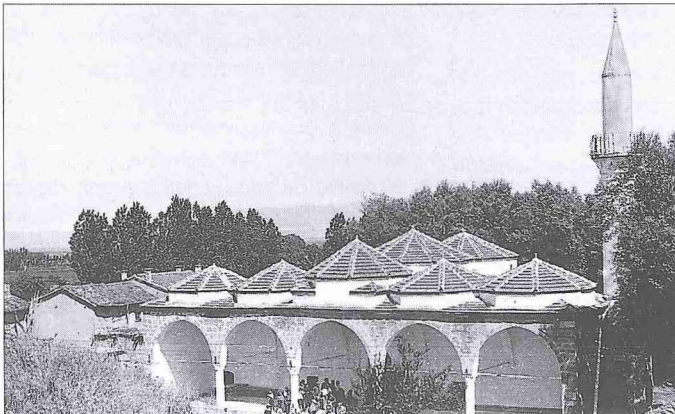
Sinan Paşa Camii – Sinanpaşa / Afyonkarahisar

Külliyein cümle kapısı kimeri üzerindeki esas kitâbesinin altında boya ile yazılmış ikinci bir kitâbe yer almaktadır. Boya ile yazılmış manzum kitâbenin gerek ifadesinde gerek imlâsında tam anlaşılabilen bir durum vardır. Tarihi de silikçe olmakla beraber tahminimize göre üstteki esas kitâbenin benzeri olup 932 (1525-26) olarak teşhis edilebilmektedir. İçinde gizli bazı mânalar olduğu sanılan bu kitâbenin esas yapı kitâbesinden kısa bir süre sonra yazılmasına bir anlam verilememektedir. Ayrıca caminin dışında kible duvarının saçağı dibinde aşağıdan oldukça zor okunabilen geç döneme ait üçüncü bir kitâbe bulunmaktadır. Mihrabın tam üstüne isabet eden yuvarlak pencerenin hizasında sivri üçgen şeklinde bir alınlık içerisinde bir mermer levha üzerine işlenmiş üç satırlık bu kitâbeden caminin Sinan Paşa ailesine mensup Necib Nûri Efendi adındaki bir kişinin himmetiyle 1293'te (1876) tamir ettirildiği öğrenilmektedir. Kitâbede bu tamirin Sultan Murad döneminde yapıldığı haber verilmektedir. Bu durum son