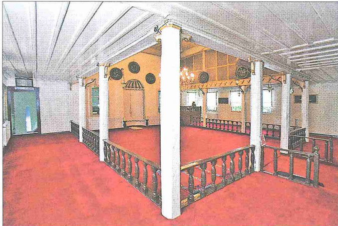
Eyüp Ümmî Sinan Tekkesi Mescid- Tevhidhânesi