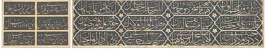
Sokullu Mehmed Paşa Çeşmesi ile medresenin avlu kapısı üzerindeki kitâbeler

Yapılar kuzey-güney doğrultuda ve aynı eksendedir. Diğer kapı türbe, derslane ve medreseden alçak bir duvarla ayrılmış olup buradan yapıların doğusunda kalan dârülkurrâyâya geçilir. Aynı zamanda bu ikinci avludan medresenin kuzeydoğu köşesindeki bir kapı vasıtasıyla medresenin iç avlusuna ulaşılır. Yakınında Eyüp Sultan Camii'nin yer almasından dolayı camiye yer verilmeyen külliye derslane-türbe ilişkisi saçakla örtülü bir revakla sağlanmıştır.