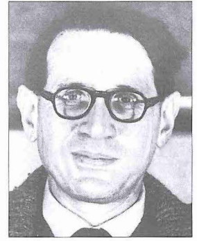
Samuel Miklos Stern

1951'de The Encyclopaedia of Islam 'ın ikinci edisyonuna genel sekreter