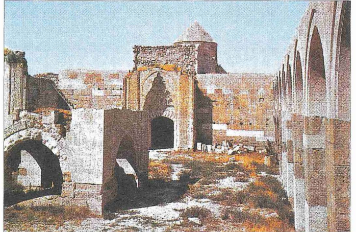
Kayseri-Sivas yolu üzerindeki Sultan Hanı

Avlunun ortasında dört kemerli alt yapıyla köşk mescid yer almıştır. Dıştan 8 x 8 m., içten yaklaşık 5,30 x 5,30 m. ölçülerinde kare planlı mescid mekânı dört ayak üstüne dört kemerli açıklıktan oluşan alt yapı üzerine yerleştirilmiştir. Mescidin köşelerinde her birinin üzeri farklı geometrik desenlerle işlenmiş sütunçeler bulunmaktadır. Alt yapıyı oluşturan kemerlerden doğu ve güney yöndekilerin üzerinde pul desenleriyle işlenmiş kıvrımlı gövdeleri, çekik gözleri ve sivri dişleriyle tasvir edilmiş karşılıklı birer ejder yer almaktadır. Dış geometrik ve bitkisel bordürlerle çevrelenmiş yapının doğu ve batı yönlerinde geometrik bordürlerle çevrili birer pencere ile kuzey yönünde kapı bulunmaktadır. Kuzey cephesinde geometrik ve bitkisel süslemeli üç rozet mevcuttur. Güney cephesindeki mihrap iç içe iki nişten mey-