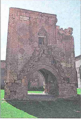
Kayseri Sultan Hanı'nın köşk mescidi

dana gelmiş olup mukarnas kavsaralı ve geometrik bordürlü, rûmî geçmeli süslemeli bir düzene sahiptir. Mescidin iç mekânında kuzey cephesindeki bir kapı duvar içindeki merdivenlerle çatıya ulaşmaktadır. Üst örtüsü oldukça harap durumdaki bir çapraz tonozdur. Köşk mescidin ibadet mekânına kuzey yönündeki kemerin iki yanına yerleştirilmiş, altları mukarnaslı çift çıkışlı basamaklarla ulaşmaktadır.