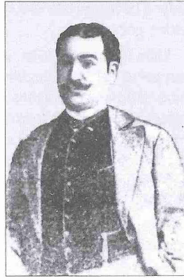
Sultan Mecid Ganizâde

Eserleri. 1. Polneyşiy Samouçitel Tatarskogo Yazıka Kavkazskogo: Azerbaydjanskogo Nareçiya . Eserin birinci ve ikinci bölümleri Türkçe olarak İstilâh-ı Azerbaycan (1890) adını da taşır. Kitabın birinci bölümünde fonetik, ikinci bölümünde morfoloji ve sentaks konuları işlenmiş-