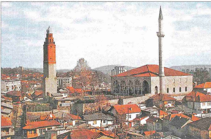
Üsküp'te Sultan Murad Külliyesi – Makedonya

Medrese. Evliya Çelebi'nin Üsküp'ün en tanınmış medreselerinden biri olarak tanımladığı medrese ( Seyahatnâme , V, 556) cami avlusunun güneybatı köşesinde bulunmaktaydı. Cami ile aynı tarihte inşa ettirilen medresenin günümüze gelen fo-