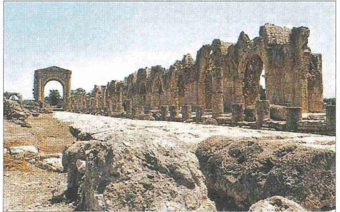
Tarihi Sür şehrinin mimari kalıntılarından bir görünüşü

Kasım 1187'de Sûr'u kuşatan Selâhaddîn-i Eyyübî, kışın bastırması ve orduda çıkan salgın hastalıklar yüzünden kuşatmaya son verip 1188 yılının ilk günlerinde Sûr'dan ayrıldı. Aynı yılın yaz aylarında Sicilya kralının gönderdiği yetmiş gemilik donanma Sûr'un tahkimatını güçlendirdi. Böylece Haçlılar'ın elinde kalan tek müstahkem şehir olan Sûr, III. Haçlı Seferi orduları için önemli bir üs oldu. I. Richard ile Selâhaddîn-i Eyyübî arasında 1 Eylül 1192'de yapılan barış anlaşmasına göre Yafa ve Sûr arasındaki sahil şeridi Haçlılar'da