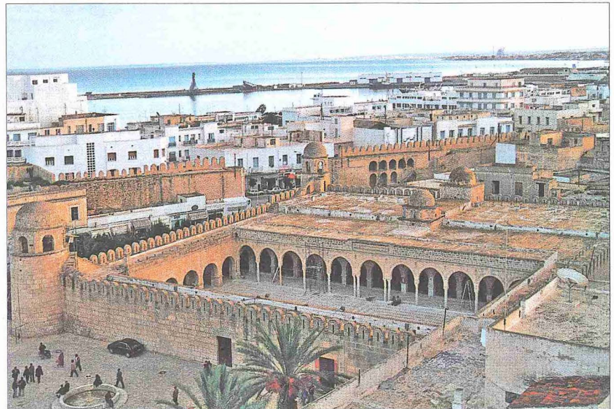
Süse Ulucamii – Tunus

Süse Ulucamii, Ağlebi mimarisinin günümüze fazla değişmeden gelen örneklerinden biri olması bakımından önem taşımaktadır. Enlemesine düzenlenen ibadet mekânının kuzeyinde revakların çevrelediği bir avludan meydana gelen plan şeması, bu bölgede daha önce Kayrevan'da Sidi Ukbe ve Tunus'taki Zeytüne camilerinde kullanılmıştır. Ancak Süse Uluca-