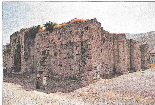
Susuz Han ve planı

Antalya-Burdur yolunda Bucak kasabası yakınındaki Susuz köyündedir. Kitâbesi günümüze ulaşmayan kervansarayın mimari ve süsleme özelliklerine göre II. Gıyâseddin Keyhusrev'in saltanatının son yıllarında (1246 civarı) inşa edilmiş olduğu düşünülmektedir. Susuz Han, günümüze 28 x 30 m. ölçülerindeki kareye yakın dörtgen planlı kapalı bölümlü ulaşılabilir. Doğu-batı doğrultulu yapının doğu cephesinde geometrik, bitkisel ve fi-