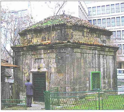
Belgrad'da Osmanlı dönemine ait bir türbe

sinin en önemli şehirleri olan Novi Pazar, Tutin ve Sjenica'da müslümanların nüfusu % 70'ten fazla olmakla birlikte diğer şehirlerdeki nüfusa oranları daha düşüktür. 1991'de Slovenya, Hırvatistan, Bosna-Hersek ve Makedonya Yugoslavya'dan ayrıldığında Sancak bölgesi Sırbistan ve Karadağ'dan oluşan Savezna Republika Jugoslavije (SRJ) adındaki yeni federasyonun içinde kaldı. Sancak'taki Sancak Müslümanları Millî Meclisi tarafından 25-27 Ekim 1991 tarihinde düzenlenen referandumda seçmenlerin % 98,9'u söz konusu federasyon içerisinde Sancak bölgesinin özerkliği için "evet" oyu kullandı. Ancak referandum dönemin Belgrad rejimi tarafından kabul edilmedi ve bölgede Bosna-Hersek ve Kosova savaşları devrinde (1992-2000) büyük sıkıntılar yaşandı. 22 Nisan 2001'de Karadağ'daki seçimleri kazanan devlet başkanı M. Djukanović, Yugoslavya'dan bağımsızlık için referanduma gideceğini ilân etti. 21 Mayıs 2006 tarihinde Karadağ'daki referandumda bağımsızlık çıkınca Karadağ Cumhuriyeti 3 Haziran 2006 tarihinde bağımsızlığını ilân edip resmen Sırbistan Cumhuriyeti'nden ayrıldı ve Sancak bölgesi böylece iki kısma bölündü. Karadağ Cumhuriyeti'ne ait Sancak bölgesinin Pljevlja (Taşlica), Bijelo Polje (Akova), Berane, Rožaje ve Plav gibi şehir merkezleri ve etrafı Sırbistan'dan ayrıldı. Günümüzde Sırbistan'da kalan bölüm ise Novi Pazar, Tutin, Sjenica, Prijepolje, Nova Varoš ve Priboj gibi şehir merkezleri ve etraftaki köylerden oluşmaktadır.