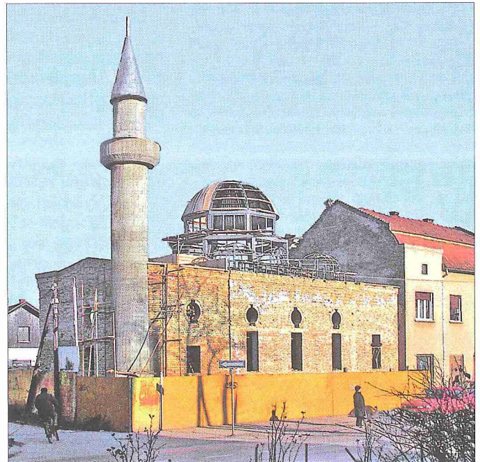
Subotica'da yeni inşa edilen cami