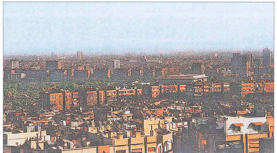
Suriye'nin başşehri Şam'dan bir görünüşü

Başlangıçtan Osmanlı Dönemine Kadar. İslâm fetihlerinden önce Suriye'de Bizans'ın