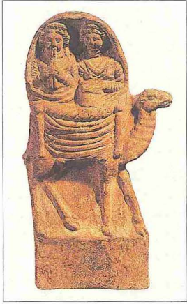
Roma döneminde, Suriye'de yapılmış kilden bir heykelticik

dildiği yıllarda Dimaşk ve Humus cündlri-ne ayrılan Suriye'de Yezid b. Muâviye devrinde kuzey bölgelerinin bağlandığı Kinnesrîn cündü oluşturuldu. Humus ve Kinnesrîn valileri nüfuz sahibi kabilelerden seçiliyordu. II. Muâviye'nin ölümü üzerine Kinnesrîn ve Humus valileri Abdullah b. Zübeyr'e itaat etmişti. II. Muâviye tarafından, yerine bir halife seçilinceye kadar devlet işlerini yürütmekle görevlendirilen ve Dimaşk'taki Kaysîler'in lideri olan Dahhâk b. Kays da Abdullah b. Zübeyr'i destekledi ve Câbiye görüşmelerinde halife seçilen Mervân b. Hakem'e karşı isyan etti. Kinnesrîn, Humus ve Filistin ordugâhlarından temin ettiği yardımıyla gücünü arttırdı. İki taraf arasında Mercirâhit'te yapılan savaşı Kelb kabilesinin desteklediği Mervân kazandı; böylece Emevî saltanatının devamını ve halifelüğün ailenin Mervânî koluna geçmesini sağladı (Muharrem 65 / Ağustos-Eylül 684). Mervân ilk olarak Abdullah b. Zübeyr'i destekleyen Kaysîler'e mensup valileri görevden aldı ve Suriye'de kontrolü tamamen ele geçirdi. Kelb ve Kays kabileleri arasındaki Mercirâhit savaşı, iki kabile grubu arasında Emevîler'in yıkılışına kadar süren ve Suriye tarihinin karakteristiğini oluşturan kabile mücadelelerinin başlangıcı oldu.