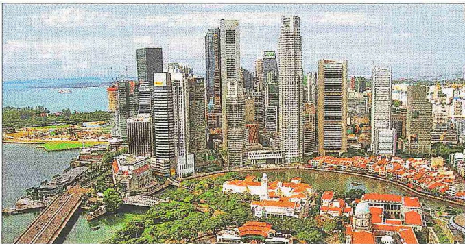
Modern Singapur şehrinin bir görünüşü

Güneydoğu Asya'da uluslararası deniz yollarının kavşak noktasında yer alan Singapur'un gerçek tarihi, 1818 yılında Sir Thomas Stamford Raffles tarafından İngiliz Doğu Hindistan Şirketi'nin Çin ile olan ticaretini geliştirmek için burada bir üs kurmasıyla başlar. Ertesi yıl Johor (Cohor) Hükümdarı Sultan Hüseyin ile yaptıkları bir antlaşmayla da adada kalıcı yerleşim kurma izni alan İngilizler kısa süre sonra Singapur'u işgal ettiler ve 1824 tarihli İngiliz-Hollanda Antlaşması'yla bu fiili durumu resmîleştirip Malaylı yetkililere de onaylattılar. Bu tarihten sonra önemi gittikçe artan Singapur, XIX. yüzyılın ortalarında bölgede üretilen ticaret mallarının dünyaya pazarlandığı önemli bir ticaret merkezi haline geldi. Böylece her türlü vergi ve harçlardan muaf tutulan Singapur Limanı mal ve hizmetlerin özgürce dolaştığı bir yer ve Doğu-Batı ticaretinin üssü oldu; Hindistan ve İngiltere'den gelen Avrupalı tüccarlar burada birer şube açarak Asya mallarını dünyaya pazarlamaya başladılar.