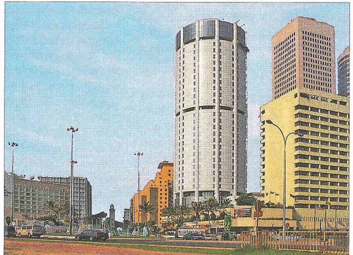
Sri Lanka'nın başşehri Colombo'dan bir görünüş

Morolar denilen müslümanlar, adanın doğu kesimlerinde yoğunlaşmakla birlikte ülkenin her yerine dağılmış durumda Sihalî ve Tamil topluluklarıyla birlikte yaşamaktadır. Büyük çoğunluğu, eski dönemlerde yerli kadınlarla evlenerek buraya yerleşen Arap tüccarlarının neslinden gelenler oluşturur. Morolar'ın halen Tamilce konuşmaları sebebiyle Hindistan'dan göçtükleri ve Tamil kökenli oldukları ileri sürülürmüşse de kendileri bunu kabul etmeyip ısrarla Arap asıllarına sahip çıkarlar. Ayrıca sömürge döneminde Cava'dan ve Malay yarımadasından gelen işçi ve askerlerin nesline mensup Malaylar ile Hint asıllı Memonlar, Bohrâlar, Hocalar (Khojas), Afganlar ve Fakirler adıyla bilinen küçük müs-