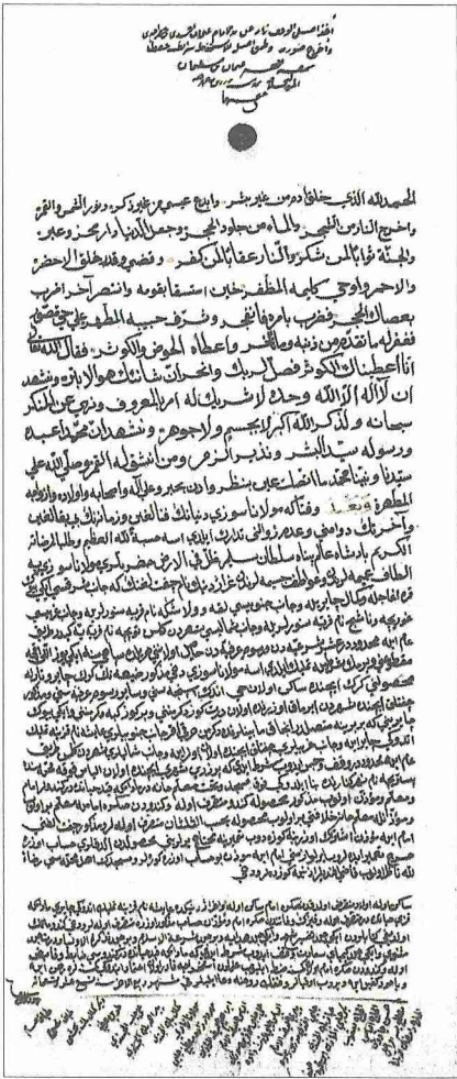
Sûzî Çelebi vakfınâmesi (Virniçâ, s. 40)

zelle padişaha şikâyet etti ve onu azlettirdi. Bu olayla padişahın takdirini kazanan şaire Yavuz Sultan Selim, Prizren yakınlarında bugün de mevcut olan Grajdaniik çiftliğine verdi. Buranın gelirini yaptırdığı cami ve medreseye vakfettiği, 919 (1513) tarihli bir sûreti günümüze ulaşan vakfınâmesinden anlaşılmaktadır. Sûzî Çelebi vefatına kadar bu camide imamlık ve medresede hocalık yaptı. 1 Muharrem 931'de (29 Ekim 1524) Prizren'de vefat etti ve camisinin hazîresine defnedildi. Sûzî vakfiyesinin şahitlerinden olan kardeşi Nehârî'nin (ö. 929/1523) kabri de aynı hazîrededir. Vakfiyeden Sûzî Çelebi'nin Ayşe adında bir kızı olduğu öğrenilmektedir. Sûzî'nin şairliğinden övgüyle bahseden şuarâ tezkireleri, onun şairlikte en üst noktayı yakalayan sanatkar bir tabiata sahip olduğunu ifade etmektedir. "Serv-i kaddin dikmesi-