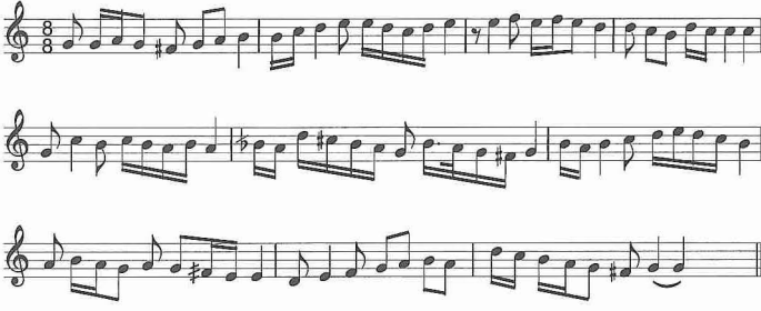
Sûzidilârâ makamı seyir örneği

dana geldiği şeklinde tarif edilmişse de eldeki eserler bu tarifi doğru olmadığını ve adı geçen iki nazariyatçının makamı doğru anlayamadığını göstermektedir. Nitekim Rauf Yektâ Bey bu makam için, "Rast, bûselik, hüseyî gibi yekdiğerine mübâyene-ti muhtâc-ı îzah görülmeyen üç makamın bir sûret-i mâhirânede mezc ve telifinden hâsıl olan sûzidilârâ" ifadesini kullanmıştır (YM, sy. 16 [1917], s. 310). Rauf Yektâ Bey'in bu tarifi eldeki eserlerin yapısına en uygun olanıdır. Belki buna bir de hü-mâyun makamını eklemek gerekebilir. Zaten III. Selim gibi büyük bir mûsiki bes-tekârının sadece majör-minör ilişkisine dayanan, Türk mûsikisinin en karakteris-tik perde ve çeşnilerinin yer almadığı, bu mûsikinin renklerini taşımayan bir makam icat etmesi mantığa aykırıdır.