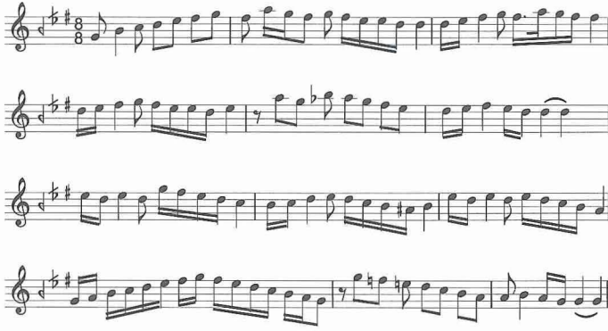
Basit sûzinak makamı seyir örneği

Zirgüleli Sûzinak Makamı. Şed makamlardandır. Fakat genelde “zirgüleli” sıfatı pek kullanılmaz ve pratikte her ikisi için de sûzinak adı tercih edilir. Dizisi zirgüleli hicaz makamı dizisinin rast perdesine göçürülmesiyle elde edilmiştir. Bu sebeple durak perdesi de basit sûzinak gibi rast perdesidir ve seyir karakteri yine diğerleri gibi inici-çıkıcıdır. Zirgüleli hicaz dizisinin, düğâhtaki hicaz beşlisine beşinci derece üzerinde bir hicaz dörtlüsünün eklenmesiyle elde edildiği bilinmektedir (bk. ZİRGÜLELİ HİCAZ). Bu dizi rast perdesine aynen göçürüldüğünde zirgüleli sûzinak makamı dizisi elde edilmiş olur.