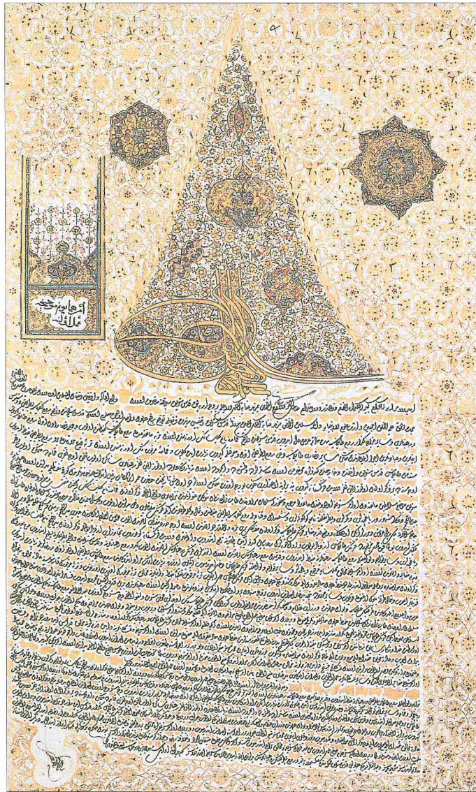
II. Süleyman tuğralı müzehhep ferman (BA, Müzehhep Fermanları, nr. 684)

Bu sırada Yeğen Osman Paşa gönderdiği mektupta Özice ve Yenipazar taraflarında yapılan savaşlarda Avusturya kuvvetlerinin Sava nehrini geçtiğini, kendisinin Niş'e çekildiğini bildiriyor, takviye kuvvet ve para talebinde bulunuyordu. Mora tarafından ise Eğriboz'un Venedikli kuşatması altında bulunduğu ve kısa sürede yardım ulaşmazsa Belgrad'ın düşeceği haberleri geldi. Halk Tuna gemileriyle şehri terk ederek Fethülslâm (Gladova) taraflarına kaçıyordu. Bunun üzerine II. Süleyman 15 Zilkade 1099'da (11 Eylül 1688) Edirne'ye hareket etti. Yeğen Osman Paşa'ya gönderilen fermanlarda o tarafları muhafaza etmesi emrediliyordu. Padişah Hafsa'ya ulaştığında Belgrad'ın Maximilian Emmanuel kumandasındaki Avusturya kuvvetlerinin eline geçtiğini öğrendi ve ağlayarak, "Emir Allah'ındır" dedi. Ancak cepheden gelen iki başarı haberiyle biraz teselli buldu. Bunlardan ilki Lehistan cephesinde Kırım kuvvetlerinin Selim Giray'ın idaresinde kazandığı başarılar, diğeri ise