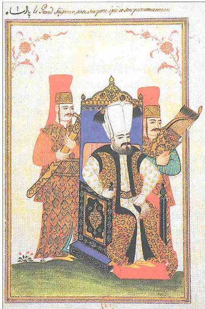
Sultan II. Süleyman'ı tahtında gösteren bir minyatür (Paris Bibliothèque Nationale, Cabinet des Estampes, Od nr. 6)

İstanbul'da bu hadiseler cereyan ederken sınır boylarından kalelerin düştüğü haberleri geliyordu. Çevreyle bağlantısı kesilen Kuzey Macaristan'daki Eğri, İstolni Belgrad, Lipova, İlok, Varad ve Lugos; Kuzey Karpatlar'da bulunan Munkacs ile Sava nehrinin güney ve kuzeyinde bulunan Derbend, Gradişka, Seddüislâm ile Eski ve Yeni Obraca kaleleri Avusturyalılar'ın, Yunanistan'daki İstefe ile Bosna'daki Knin ve