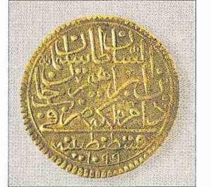
II. Süleyman döneminde ait 1099 (1687-88) tarihli kuruluş (Yapı ve Kredi Bankası Sikke Koleksiyonu, nr. 3929)