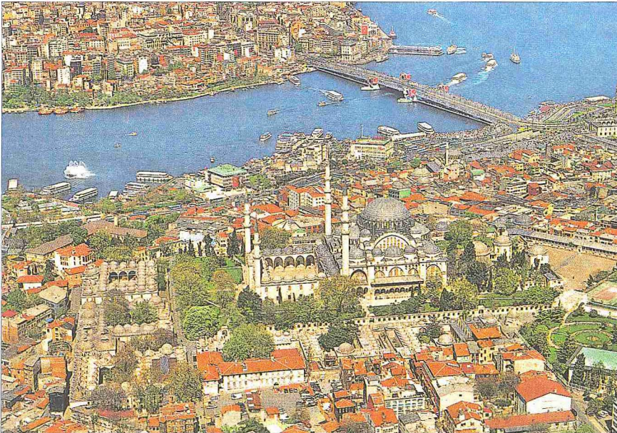
Süleymaniye Camii ve Külliyesi'nin kuş bakışı görünüşü

Bugünün ölçülerine göre bile oldukça hızlı ilerleyen külliye inşaatı, ortada cami olmak üzere bütün yapıları "U" düzenine göre sıralayan bir durum planı göstermektedir. Yaklaşık altmış dönümlük ara-