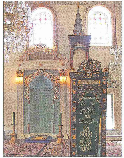
Rodos Süleymaniye Camii'nin mihrap ve minberi