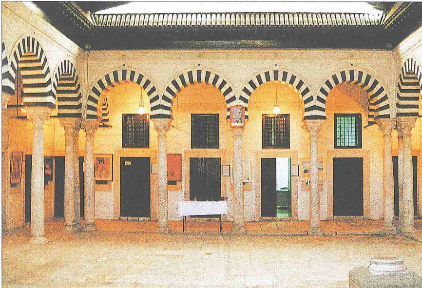
Tunus'ta Süleymaniye Medresesi'nin revaklı avlusu

Kapıdan üzeri kubbe ile örtülen kare planlı giriş holüne geçilmektedir. Holün batı duvarının alt kısmında altı küçük kemerle oluşturulan bir sedir yer almaktadır. Sedirin bulunduğu duvarla güney duvarı yerden 2,20 metreye kadar çini ile kaplıdır. Çini süslemelerde daha çok mavi, kahverengi, yeşil ve sarı renkler hâkimdir. Buradaki kompozisyonlar yeşil zemine mavi renkli iri yapraklar ve koyu kahverengi çiçek motifleri bulunan bordürlerle siyah konturların çevrelediği, bir vazodan çıkan stilize palmet, rûmî ve kıvrık dallarla meydana getirilmiş büyük panolardan oluşur. Bu kompozisyon en üstten palmet, kıvrık dal ve yaprak dizileriyle süslenmiş daha ince bir bordürle kuşatılmıştır. Bu holden at nalı kemerli sade bir kapı ile avluya girilmektedir. 16 x 11,40 m. ölçülerindeki dikdörtgen avlu, dört yönden revaklarla çevrelenmiştir. Avludan bir seki ile ayrılan revaklar köşelerde üçer tane olmak üzere toplam yirmi beş sütuna oturan at nalı kemerlere sahiptir. Kemerlerde siyah-beyaz taşlar alternatif şekilde dizilmiştir. Kemerlerin üstünde avluya doğru eğimli kiremit kaplı saçaklar yer almış-