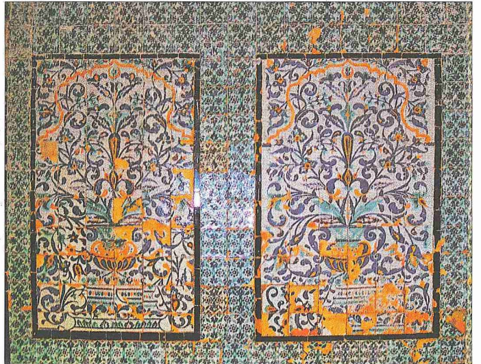
Süleymaniye Medresesi'nin giriş bölümü duvarındaki çiniler

Kanûnî Sultan Süleyman'ın tahta geçtiği 1520 yılından itibaren uzun süren saltanatı boyunca seferlerini ve dönemin diğer olaylarını anlatmak için yazılan eserler özel bir ad taşısın veya taşımasın genellikle "Süleymannâme" diye anılmıştır. Süleymannâme yazma geleneği, o sırada henüz teşekkül etmiş olan Selimnâme geleneğinin bir devamı şeklinde ortaya çıkmıştır. Hatta Kanûnî'nin tahta çıkışıyla ilgili ilk bilgiler kendisine takdim edilen bazı Selimnâmeler'de yer almıştır. Kazanılan zaferlerle birlikte yazılmaya başlanan Süleymannâmeler'in bir kısmı, müellifleri tarafından zaman içerisinde yeni seferleri ve olayları da içine alacak biçimde tekrar ele alınıp ilâvelerle genişletildiği gibi (Bostan Çelebi'nin Süleymannâme'si ) birbirini takip eden seferlerin farklı isim ve cüzler halinde kaydedildiği, fakat neticede bir Süleymannâme'yi oluşturan eserler de mevcuttur (Matrakçı Nasuh'un Süleymannâme'si ). Bir diğer Süleymannâme çeşidi de Kanûnî'nin uzun saltanatının sonuna doğru yazılan ve geçen sürede telif edilmiş tarihlerden ve diğer resmî belgelerden fay-