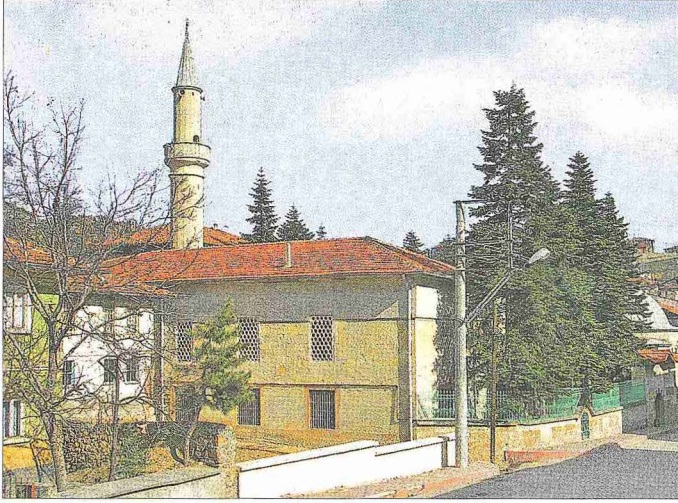
Şâbân-ı Velî Camii – Kastamonu