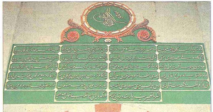
Şâbân-ı Velî Külliyesi'nin avlu kapısı üzerindeki kitâbe

Şâbânîyye'nin silsilesi Şâbân-ı Velî, Hayreddin Tokadî, Cemâl-i Halvetî, Pîr Muham-