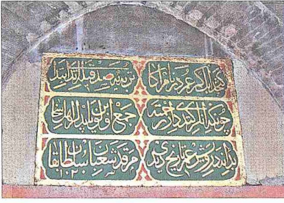
Şâbân-ı Velî Türbesi üzerindeki kitâbe

mürşidi Şücâ' Efendi tarafından yeniden inşa edilmiştir. Cami aynı zamanda tekkenin tevhidhânesi olarak kullanılmıştır. Halvetîlik 1925 yılında tarikatların kapatılmasına kadar faaliyetini sürdürmüş, tekkede Şâbân-ı Velî'den sonra on yedi şeyh görev almıştır. Çok sayıda onarım geçiren ve 1872'de yeniden inşa edilen tekkenin anılan tarihte şeyhi Hâfız Mehmed Said Efendi ve âyin günü cuma gecesi idi. 1114 (1702-1703) yılında caminin bitişiğindeki derviş odaları, matbah, pencere ve halvetler tamir edilmiştir. 1162'de (1749) tekrar onarım gören külliye avlu kapısı üzerindeki kitâbelere göre 1189 (1775) yılında Mehmed Paşa ve 1845'te Sultan Abdülmecid'in emriyle Kastamonu Kaymakamı Sâlih Ağa yeniden tamir ettirmiştir. Külliye son olarak 1950'de Vakıflar Genel Müdürlüğü tarafından onarılmış, caminin minaresi de bu dönemde yenilenmiştir. Evkaf sicilinin 26. sayfasında kayıtlı vakfiye ile 990 (1582) yılında bazı yerlerin gelirlerinin buraya tahsis edildiğini Mehmed Behçet kaydetmektedir (s. 152).