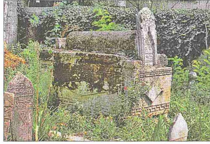
Şah Melek Bey'in Şah Melek Camii hazinesindeki kabri

Bunların sonradan ilâve edilen bir sundurmaya ait olduğu kabul edilmektedir. Harimin güney ve batı cephelerinde üç sıra halinde beşer pencere, kuzey cephesinde diğer cephelerdeki orta sıra pencereleri hizasında iki pencere mevcuttur. Doğu cephesinde üç sıra halinde altı pencere vardır. Harim gövdesinin üst kesiminde bütün cepheleri dolanan ve bir dizi silmeden oluşan bir saçak mevcuttur. Onikigen prizma şekilli kasnak gövdeye oranla basıktır. Gövdenin üst kesiminde doğu, batı ve güney yüzlerinde yer alan sivri kemerli pencereler gövdeyi ikiye bölen saçak sebebiyle kasnak üzerindeymiş gibi algılanmaktadır. Caminin kuzeydoğu cephesinde kesme taşla inşa edilmiş bir minare yer almaktadır. Minareye giriş kürsünün doğu yüzü üstündeki basık kemerli bir açıklıktan sağlanmaktadır. Harimin kuzeydoğu köşesiyle minare kürsüsü arasındaki bitişme çizgisi minarenin yapıya sonradan eklendiğini düşündürmektedir. Yapının orijinal minaresinin Balkan Savaşı sırasında yıkıldığı tahmin edilmektedir.