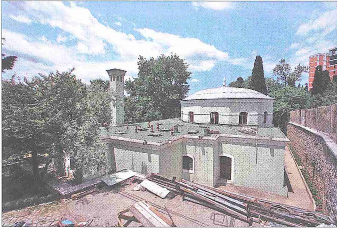
Şahkulu Sultan Tekkesi ana binasının güneyden görünüşü

Cümle kapısının soluna kuzey-güney doğrultusunda tekkenin en önemli bölümlerini barındıran ana bina yerleştirilmiştir. Bu bölümler kuzeyden güneye doğru tekkeye ulaşan mücerred babalara ve dervişlere mahsus iki katlı ikametgâh, bu kanadın içinde gündelik yemeğin pişirildiği küçük aşevi, âyinlerin icra edildiği meydan evi, özel günlerde kullanılan büyük aşevi ve çamaşırhane, kiler evi, hamam, aşevi babası ile kiler evi babasının hücreleridir. Ana bina, kuzey ve doğu yönlerinde daha ziyade babaların gömülü olduğu bir hazîre ile kuşatılmıştır. Şahkulu Sultan'ın açık türbesi de bu hazîrededir. Ana binanın batı yönünde bahçeye bakan setler üzerinde havuzlar ve çardaklar göze çarpar. Bu kesimde cümle kapısının tam karşısında tekkeye gelen hatırlı misafirlerin ağırlandığı, şeyh odası niteliğinde bir mekânın bulunduğu bilinmektedir. Ayrıca tekkenin bahçesinde ekmek evinin (fırın), zenbûr evinin, koyun ve inek ağıllarının ve koza-