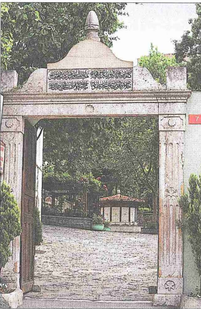
Şahkulu Sultan Tekkesi'nin cümle kapısı

Ana binanın kuzey kesimi "L" planlı ve iki katlı kitlesiyle ikametgâh şeklinde düzenlenmiştir. Duvarlar tuğla olup pencerelerin çoğu ve kapılar sepet kulpu kemerlerle donatılmıştır. 1960'larda bir yangında harap olan yapı son yıllarda yalnız cepheleri eski haline uygun biçimde yeniden inşa edilmiştir. Özgün planı hakkındaki bilgilerin sınırlı olduğu yapıda güneydeki kapı dışında kuzeyde Şahkulu Sultan makamına açılan ikinci bir kapı bulunmaktadır. Ana binanın güneyindeki tek katlı kanada batı cephesinden girilir. Duvarlar moloz taş ve tuğla ile örülmüştür. Büyük aşevi ile çamaşırhanenin yer aldığı mekân düzgün olmayan bir plana sahiptir. Girişin sağında yer alan büyük ocak aynı zamanda hemen arkada bulunan hamamın külhanı olacak şekilde tasarlanmıştır. Aşevi ocağından sonra hamamın girişi, bunun ötesinde çamaşırhane ocağı yer alır. Solda (kuzey yönünde) meydan evinden bu kanada açılan iki adet kapı-pencere görülür. Doğuda yan yana kiler evi ile kiler evi babasının hücreleri sıralanmaktadır. Bir camekân-ılıklik, bir halvet ve bir helâdan oluşan hamamda ilginç mimari ayrıntılar göze çarpar. Bunlardan biri halvetle camekân-ılıklik arasındaki duvarda bulunan tütekli bir lamba penceresidir. Diğeri de camekân-ılıklik mekânının güney duvarında yer alan, alçı kabartma perde motifleriyle çerçevelenmiş, geç dönem halk resmi türünde hayali bir peyzajla bezenmiş olan niştir. Aşevi babasının hücreleri kanadın güneybatı köşesine sonradan eklenmiştir.