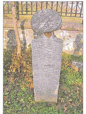
Şânizâde Mehmed Atâullah Efendi'nin mezar taşı (Tire Müzesi, Envanter nr. 1453)

Yeniçeri Ocağı'nın ortadan kaldırılması sırasında Bektaşiliğin de yok edilmesine girişildiğinden Şânizâde, Beşiktaş Cem'iyet-i İlmîyesi'ne mensubiyetinden dolayı 9 Zilkade 1241'de (15 Haziran 1826) Bektaşî olduğu ileri sürülerek arpalığı olan Tire'ye sürgün edildi. İki ay sonra da burada vefat etti. Kaynaklarda, böyle bir âlimin sürgünde bulunmasına gönlü razı olmayan II. Mahmud'un af fermanı yazdığını, bunu getiren kavaşın Şânizâde'nin kaldığı konağa gelip telâş içinde yanlışlıkla, "Şânizâde'nin itlâfına ferman getirdim" demesi üzerine her an İstanbul'dan kötü bir haberin gelmesini beklemekle olan Şânizâde'nin olduğu yere yığıldığı ve kısa bir hastalığın ardından 1 Muharrem 1242'de (5 Ağustos 1826) öldüğü belirtilir. Kışla civarındaki mezarlığa defnedilen Şânizâde'nin kabri bu mezarlığın 1916 yılında kaldırılmasıyla kayboldu. Daha sonra mezarındaki taş kasaba civarında tesadüfen