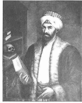
Şânizâde Mehmed Atâullah Efendi'nin temsili resmi

İstanbul'da dünyaya geldi. Doğum tarihi tam olarak bilinmemekteyse de genellikle 1184'te (1770-71) doğduğu kabul edilir. Ancak kaynaklar, Şânizâde'nin 18 Muharrem 1200'de (21 Kasım 1785) tedris ruûsunu alıp müderris olduğunu kaydettiğini ve on dört-on beş yaşları müderrislik için biraz erken sayılacağına göre doğum tarihinin bundan birkaç yıl daha geriye gittiği söylenebilir. Özellikle fıkıh alanındaki