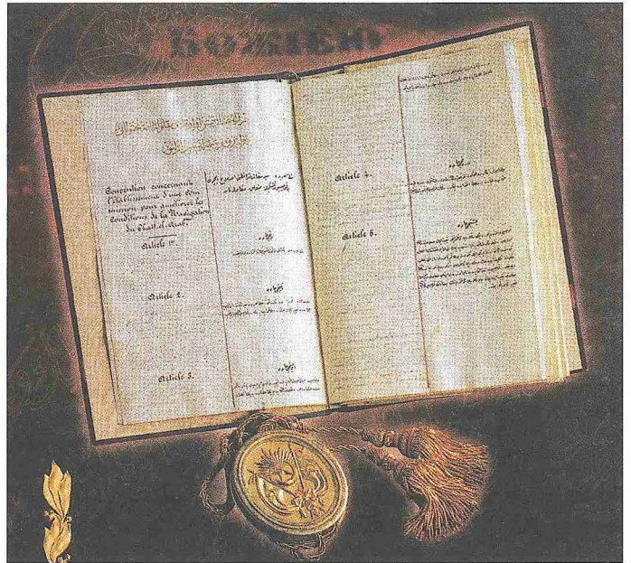
Şattülarap'ta seyrisefâinle ilgili 1913 yılında imzalanan Anglo-Ottoman Convention (BA, Muahede, nr. 366)

Cüzâm kabilesinin Benî Sa'd koluna mensuptur. Hakkındaki ilk kayıt Haçlılar elinde esirken Şevval 516'da (Aralık 1122) serbest bırakılmasıyla ilgilidir (Makrîzî, III, 83). Fâtımî Veziri Efdal b. Bedr el-Cemâli'nin Haçlılar'la yaptığı savaşlarda esir düşen Şâver'in uzun süre esarette kaldığı anlaşılmaktadır. Daha sonra Vezir Me'mûn el-Batâihî'nin kurduğu Me'mûniyye birliğinde görev aldı. Vezir Rıdvân b. Velehşâ ile Halife Hâfız-Lidîmillâh arasındaki gerginlik sebebiyle Kahire'de meydana gelen olaylar-da Rıdvân'ın tarafında yer aldı ve onunla birlikte Suriye'ye kaçtı. Rıdvân'ın 534'te (1139) Kahire önlerine gelip halifenin kuvvetleri karşısında yenilerek yakalanmasının ardından bir müddet Saîd'de bedevî kabileleri arasında yaşadı. Daha sonra affedilmekle beraber bir süre Kahire'de sarayda ikamete mecbur edildi. Ardından