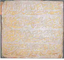
Şehâbeddin Sühreverdi Zâviyesi'nin Karamanoğulları dönemine ait kitabesi (Konya Ereğli Müzesi, Envanter nr. 136)

karnaslı bir nişe sahiptir. Etrafında geniş geometrik bir bordür yer alır. Taç kısmında palmet ve rûmîli bir süsleme görülür. Mescidin yan duvarlarının belirli yüksekliğe kadar alçı süslemeli olduğu bellidir. Mescidin güneydoğu köşesinde kare planlı, dört ayağın taşıdığı kemerler üzerine oturtulmuş, pandantifli kubbeli türbe yer alır. Türbe mekânı kuzey ve doğu yönüne nişlerle genişletilmiştir. İçerisinde dört adet ahşap sanduka bulunmaktadır. Türbenin ne zaman ve kimin adına yapıldığını gösteren herhangi bir kitabesi yoktur. Konya Ereğli Müzesi'ndeki kitabeye göre zâviye ve imaret 793 (1391) yılında Karamanoğlu Süleyman Bey'in kızı Nasiha Hatun tarafından inşa ettirildiğine göre türbe ve mescid de muhtemelen bu yıllarda yapılmıştır. İbrahim Hakkı Konyalı türbeyi Nasiha Hatun'a, Mikâil Bayram Şeyh Şehâbeddin Çoban'a atfetmektedir.