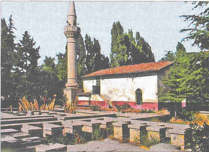
Şehâbeddin Sühreverdi Mescidi ve Türbesi – Ereğli / Konya

Mescid ve Türbe. 1950-1951 yıllarında onarılarak bugünkü görünümünü kazanmış, daha önce yer yer çökmüş bir halde düz toprak dam iken üzeri ahşap çatı ile örtülmüştür. Giriş bölümü harimden bir cemekele ayrılmış, üstüne ahşap korkuluklu galeri katı yapılmıştır. Mescid bölümü dikdörtgen planlıdır. Üst örtü içten, tavan dıştan eğimli ahşap çatıdır. Mihrabın üzerinde üç sivri kemerli tepe penceresi bulunmakta, batı yönünde bir pencere, doğudaki açık türbeye bir büyük pencere ile açılmaktadır. Bu pencereler büyük sivri kemerli nişler içerisinde yer almaktadır. Eski fotoğraflardan mescidin mihrabının çok zengin alçı süslemelerle bezeli olduğu anlaşılmaktadır. Alçı mihrap mu-