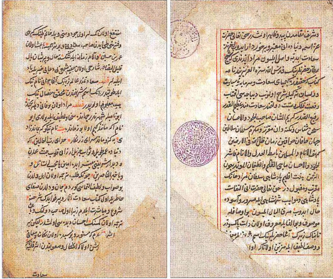
Şem'î'nin Şerh-i Pend-i Attâr (Saadetnâme) adlı eserinin telif sebebiyle ilgili mukaddime kısmından (Millet Ktp., Ali Emîrî Efendi, Manzum, nr. 108)