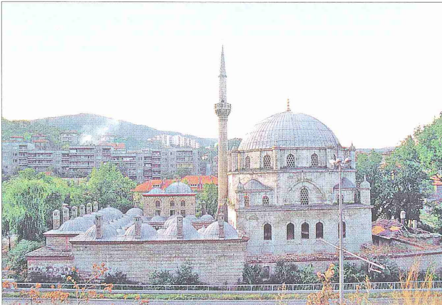
Şerif Halil Paşa Külliyesi – Şumnu / Bulgaristan