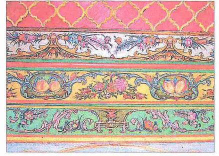
Şerif Halil Paşa Camii'nin harım kısmı kalem işi süslemesinden bir detay

Cami 15 x 15 m. ölçülerinde kare planlı olup üzeri kubbe ile örtülüdür. Caminin en