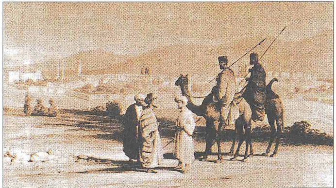
1930'lu yıllarda Urfa'yı gösteren taşbaskı gravür (Francis Rawdon Chesney, The Expedition for the Survey of the Rivers Euphrates and Tigris , London 1850, I, 114)

BA, TD, nr. 64, s. 385-451; nr. 295, s. 6-20; nr. 362, s. 1-316; nr. 965, s. 1-385; nr. 998, s. 198-227; BA, MAD, nr. 29, vr. 211 a -219 b ; nr. 100, vr. 27 a -30 b ; nr. 351, s. 1-171; nr. 4540, s. 17-21; nr. 4735, s. 1-52; nr. 7457, s. 11-12; nr. 15609, s. 1-9; nr. 17642, s. 268-280; nr. 17983, s. 19-38; TK, TD, nr. 151, vr. 1 a -194 b ; nr. 204, vr. 1 a -66 b ; nr. 574, vr. 1 a -21 b ; BA, KK, nr. 293, s. 70-78, 80, 84-85; Belâzürî, Fütûh (Fayda), bk. İndeks; Taberî, Târîh (Ebû'l-Fazl), bk. İndeks; Mes'ûdî, et-Tenbîh , s. 130, 144, 152; İbn Havkal, Şüretü'l-arz , s. 236-237; Makdisî, Ahşenü't-tekâsim , s. 130, 140, 144, 152; Yahyâ b. Saîd el-Antâkî, Târîhu'l-Antâkî (nşr. Ömer Abdüsselâm Tedmürî), Trablus 1990, s. 41, 43, 427-428, 435; Sem'ânî, el-Ensâb (Bârûdî), III, 108-109; İbnü'l-Esir, el-Kâmil , VIII, 618; ayrıca