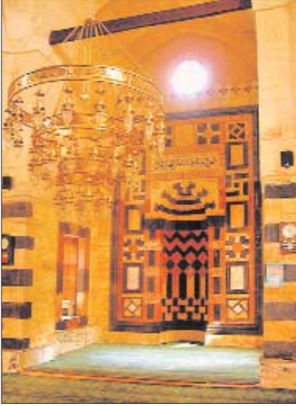
Seyh Fethullah Camii'nin renkli taş süslemeli mihrabı

neminde Orhaniye İlkokulu'na dönüştürülmüş ve sonradan yıktırılmıştır. İlk inşasının Bâli Paşa'dan dolayı daha önce olduğu ileri sürülmekte, XVI. yüzyıl ortalarında onarılarak bu külliye'nin bir parçası haline getirildiği sanılmaktadır. Ortadan kalkan medresenin mimarisi tam olarak bilinmemektedir. Avluda yeni yapılmış bir şadırvan vardır. Avlunun kuzeydoğu köşesinde alt kattaki kastele birkaç basamakla inilir. Cami ve zâviyeyi doğudan ve güneyden hazîreler çevreler. Hamam avlunun doğu kapısından çıkınca görülmekte, tonozlu bir geçitle zâviyenin doğusundaki hazîre duvarına bağlanmaktadır. Külliyyeye dahil edilen ve vakfiyede adı geçen kastelin doğu cephesine bitişik ev 1974'te yıktırılmış ve yerine Kur'an kursu binası inşa edilmiştir.