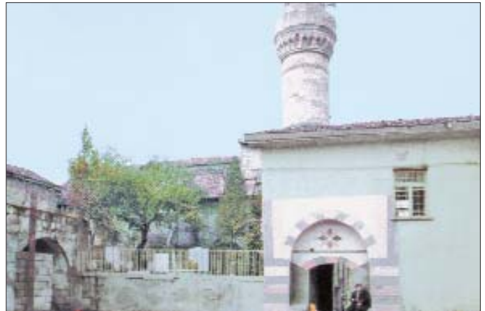
Seyh Fethullah Camii - Gaziantep

İç mekânda bezemenin en yoğun görüldüğü yerler taş mihrap ve minberdir. Yarım daire kesitli bir nişten ibaret mihrap renkli taşlarla süslenmiştir. Mihrap nişi üzengi taşı seviyesinde bir sıra mukarnasla zenginleştirilmiş, nişin köşelikleri bitkisel süslerle bezenmiş ve bu bölümlere birer kabara yerleştirilmiştir. Nişin içinde renkli taşlarla zikzak, dama taşı ve kelebek benzeri motifler yapılmıştır. Mihrap nişinin etrafı kare ve dikdörtgen formulu, renkli taş kompozisyonlu panolarla çevrelenmiş, kitâbeliği boş bırakılmıştır. Minberde renkli taş işçiliği bir kompozisyon oluşturma kaygısı olmaksızın kullanılmıştır. Mihrap ve minberdeki bu uygulamalar Memlük süsleme sanatıyla benzerlikler gösterir. Camiyi güneyden, zâviyeyi doğudan ve güneyden hazîreler çevreler. Şeyh Fethullah caminin güneyindeki hazîrede açık bir mezarda gömülüdür. Bu hazîre