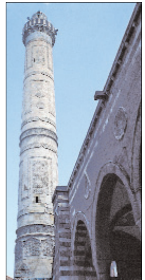
Şeyh Safâ Camii'nin minaresi

Caminin kible duvarında farklı desenler ihtiva eden ve döşeme seviyesinden 1,20