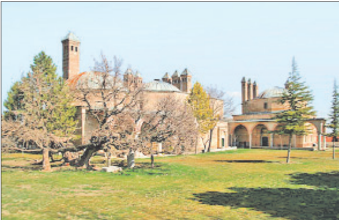
Seyh Şücâüddin Külliyesi – Seyitgazi / Eskişehir

Demirtaş (Mürvet Ali) Paşa Türbesi, Şeyh Şücâüddin Türbesi'nin kuzeyinde yer almaktadır. Tuğla ile inşa edilen türbe, yüksek kasnaklı kubbeyle örtülü sekizgen planlı mekân ve doğu cephesindeki dikdörtgen planlı, kubbeli giriş biriminden oluşmaktadır. Türbenin cephesini tek sıra, kasnağını çift sıra kirpi saçak dolanmaktadır. Yapının kuzey ve güneybatı cephesinde sivri kemerli alınlıklı ve dikdörtgen açıklıklı pencereler bulunmaktadır. Giriş biriminin basık kemerli kapısından sonra türbe ye batı cephesindeki kademeli basık kemerli kapıyla ulaşılmaktadır. İç mekânda beşgen nişe sahip mihrapla iki sivri kemer-