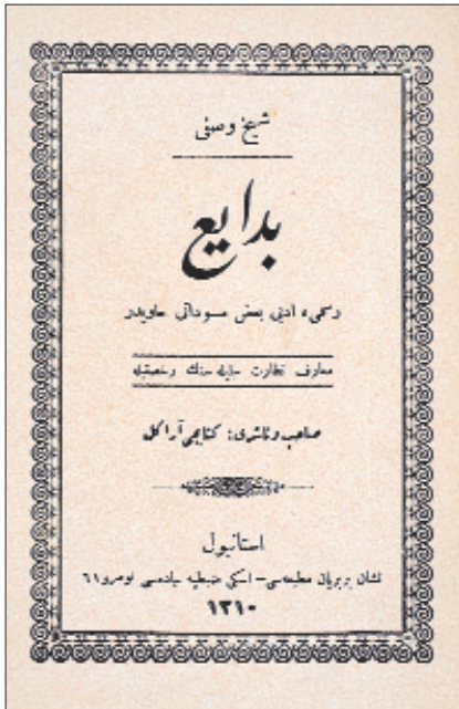
Şeyh Vafî'nin Bedâiyi' adlı eserinin kapağı (İstanbul 1310)

İlk yapılışına "Câmî-i Hâkâniyye" terkiбинin tarih düşürüldüğü (881/1476) caminin 1171 (1757) yılında tamir gördüğü mevcut kitâbeden anlaşılmaktadır. Yapı 27 x 17 m. ölçülerinde enlemesine gelişen bir plana sahiptir. Girişte beş gözlü bir revak, kible yönünde mihrap sofası ve buradan girilen bir hücre yer almaktadır. Bir sıra taş ve iki sıra tuğla ile alması olarak inşa edilen yapının üstü, sekizgen kasnak üzerine 11 m. çapında bir kubbe ve iki yanda yarım kubbelerle örtülüdür. Girişi harimden olan minare caminin kuzeybatı köşesinde bulunmaktadır. İçeride cümle kapısının önünde bir fevkanî mahfil vardır. Plan itibarıyla eski Eyüp Sultan Camii'nden etkilendiği anlaşılan yapı, yıkılmaya yüz tuttuğu gerekçesiyle XX. yüzyılın başlarında yeniden inşa edilmek üzere yıktırılmış, I. Dünya Savaşı'nın araya girmesiyle de bu