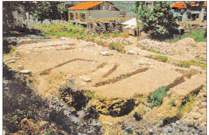
Şeyh Vefâ Camii'nin temelleri

Kaynaklarda Şeyh Vefâ Külliyesi'nin bir çeşmesinden söz edilmekte, fakat çeşmenin yapısı hakkında bilgi verilmemektedir. Vefâtürbesi sokağının Kâtipçelevi caddesi çıkışındaki Vefa Meydanı'nda birbirine oldukça yakın, biri hazneli, diğeri tek cepheli iki çeşme vardır. Üzerinde kitâbesi bulunmayan hazneli meydan çeşmesinin Şeyh Vefâ Çeşmesi olduğu eski haritalardan anlaşılmaktadır. Pervititch sigorta haritasında açıkça görülen bu çeşmenin haznesinin doğu ve güney köşesi sakalara mahsus iki yönlü bir çatal çeşme şeklinde tertip edilmiştir. Burası günümüzde metro çalışmalarından dolayı toprak altında kalmıştır.