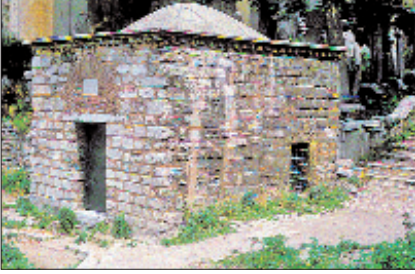
Şeyh Vefâ Türbesi ve çilehâne

inşaat gerçekleştirilememiştir. 1990-1994 yıllarında eldeki planlara uygun biçimde yeniden inşa edilmekle birlikte plana yansımayan yükseltiler ve örtü sistemi hakkında bazı soru işaretleri kalmıştır. Caminin ilk yapıldığında harimin her iki yanında üstü ikiye küçük kubbe ile örtülü tabhâne odalarının yer almış olması muhtemeldir.