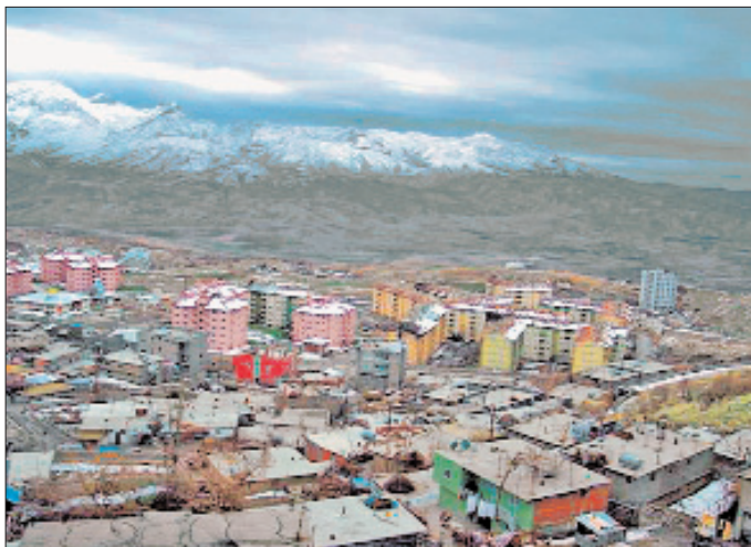
Şirnak'tan bir görünüş

Bir kesimi Güneydoğu Anadolu, diğer kesimi Doğu Anadolu bölgesinde bulunan aynı adlı ilin merkezi olan Şirnak şehri, Güneydoğu Toroslari adı verilen dağ silsile-