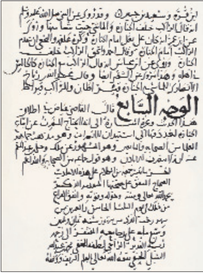
Breddin eş-Şiblî'nin Keşfü'l-ibhâm adlı eserinin müellif hattı nüshasından bir sayfa (The Chester Beatty Library, nr. 3060, vr. 161 a )

kaynaklarda el-Yenâbi' fi ma'rifeti'l-uşûl ve't-tefâri' adıyla geçen eser Muhammed b. Ramazan er-Rûmî'ye de nisbet edilmektedir (İbn Kutluboğa, s. 260, 264; Keşfü'z-zunûn , II, 1632, 1634). İstanbul kütüphanelerindeki çeşitli yazmaları Muhammed b. Ramazan adına kayıtlıdır. 4. Teskîfü'l-elsine bi-târîfi'l-izmîne . Arap diline dair bir eser olup 743 (1342) tarihli müellif nüshası Süleymaniye Kütüphanesi'nde kayıtlıdır (Lâleli, nr. 1686). 5. Zehvü'l-bedî' fi zehri'r-rebî' . Hadis ilmiyle ilgili olan eserin bir nüshası Süleymaniye Kütüphanesi'nde bulunmaktadır (Ayasofya, nr. 4032). 6. Keşfü'l-ibhâm bi-şerhi'l-aḥkâm ( Şerḥu'l-'Umde fi'l-aḥkâm ). Cermâîlî'nin 'Umdetü'l-aḥkâm adlı eserinin şerhi olup 25 Receb 738 (16 Şubat 1338) tarihli müellif hattı nüshasının dördüncü bölümü Chester Beatty Library'de kayıtlıdır (Arberry, I, 24). Şiblî'nin bunların dışında Zemmü's-semâ'î'l-mülhî ve tahrîmühü ve beyânü ḥamîdî's-şî'r min zemîmih , Risâle fi âdâbi'l-ḥammâm , el-Fuṣûl fi ahvâli'r-Resûl , Taşrîfû'l-aḳlâm ve's-sütûr fi ta'rîfi'l-eyyâm ve's-şühûr , Neşrü'l-a'lâm fi aḥkâmî's-selâm , Nüzhetü'l-kirâm ve'l-ekyâs fi zikri's-sihâm ve'l-kıyâs , Vaḳ'û'l-ḥicâbi's-sâtir fi'l-inbâ' 'ani'l-lafzi'l-mütevâtir , el-Envâ'u'l-vâride fi şalâti'l-ḥavî fi tardı'l-keḷâm , Risâle fi âdâbi'l-ḥammâm adlı eserleri bulunmaktadır ( Meḥâsin , neşredeninin girişi, s. 8-9).