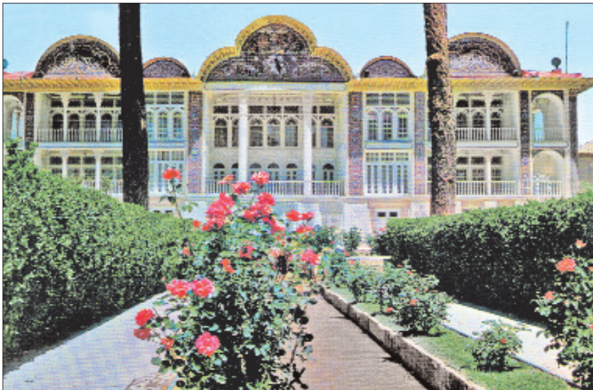
Şiraz'da Eram Bahçesi'nin içindeki saray