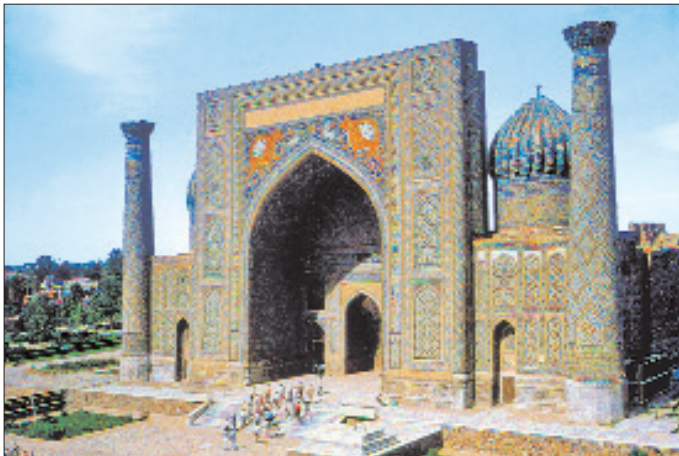
Şirdâr Medresesi – Semerkant / Özbekistan

Şirdâr Medresesi inşa ve süsleme yönünden Timurlu özelliklerini sürdürdüğü gibi Timurlular'ın, hükümdarın ve devletin azametini boyut ve sembolizm açısından vurgulama fikrini de bulunduğu devir için yansıtmak iddiasındadır. Büyük boyutlu yapı aynı zamanda taçkapısındaki çini kompozisyonuyla hükümdarın gücünü ve hâkimiyetini vurgulamaktadır. Uluğ Bey Medresesi'nin giriş cephesine benzer şekilde ele alınmış olan ana cephede, mozaik çini süslemeli taçkapı ile iki köşedeki minareler (arka köşelerde güdük kuleler şeklinde tekrarlanmış) ve Gür-ı Emîr'in (1405) dilimli kubbesini andıran yüksek kasnaklı mozaik çini ile kaplı iki kubbe dikkati çekmektedir. Güney Türkmenistan'da Anav'da inşa edilmiş, harabe halindeki Timurlu devrine ait 860-861 (1456-1457) tarihli caminin taçkapı kemerinin iki yanındaki ejder tasvirleri bu tür çini düzenlemelerinin öncü örneklerindedir. Buhara'da yaptırılan Nâdir Divan Beyi Medresesi'nde (1031/1622) taçkapıdaki bir kemer alınışına yerleştirilmiş mozaik çini tasvirlerde de benzer bir pano görülmektedir. Burada bitkisel kıvrımlarla doldurulan lâcivert bir zemin üzerine insan yüzü şeklinde tasvir edilmiş bir güneş ve ona doğru yönelen, pençelerine aldığı hayvanı götüren iki sîmurg tasviri yer almaktadır. Şirdâr Medresesi'nde benzeri kompozisyon kaplanla tekrarlanmaktadır. Kompozisyonda deği-