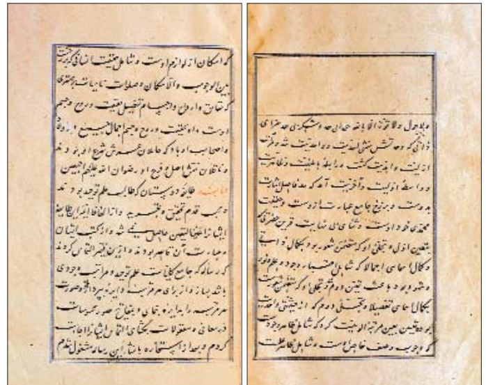
Şîrîn-i Mağribî'nin Câm-ı Cihânnümâ adlı eserinin ilk iki sayfası (Nuruosmaniye Ktp., nr. 3874/2)