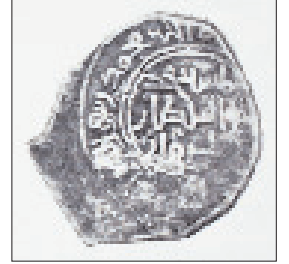
II. Menüçihir'in 555 (1160) tarihli sikkesi

ardından Safevîler'e vergi ödeyen Şirvanşahlar iç işlerinde serbestti. Şirvanşahlar'dan I. Ferîburz, III. Menüçihir, oğlu I. Ahistan (Ahsetân, Ahsitan), I. Şeyh İbrâhim ve Halil ünlü diplomat ve devlet adamları olarak tarihte iz bırakmıştır. Araştırmacılar III. Ferîburz, Kâvûs, Şeyh İbrâhim ve Ferruh Yesâr'ın iyi birer kumandan olduklarında hemfikirlerdir. II. Ahistan, Zâhidiye tarikatının piri İbrâhim Zâhid-i Geylânî'ye mürid olmuş ve Güştâsfi'de onun için bir zâviye yaptırmıştır.