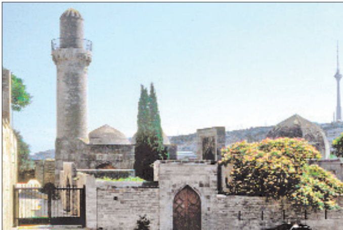
Şirvanşahlar Saray Kulliyesi Camii ve türbe binası

Ünlü kaside şairi Hâkânî-i Şirvânî, Hâkânî-i Ekber III. Menüçihir'in himayesine mazhar olmuş ve hükümdar kendisine melikü's-suarâ ve nedîmü's-suarâ unvanlarını vermiştir. III. Menüçihir'in oğlu Celâlüddeve Ahistan'ın isteği üzerine 584 (1188) yılında Nizâmî-i Gencevî Leylâ vü Mecnûn adlı eserini kaleme almıştır. III. Menüçihir ve Ahistan dönemlerinde Şirvanşahlar hânedanında Sâsânî gelenekleri güçlenmiş, özellikle kültürel hayatta egemen olmuştur. XI-XIII. yüzyıllarda şehirlerde ekonomi ve kültür alanlarında gelişmeler kaydedilmiş, hükümdarlar bilim, sanat ve edebiyatı teşvik etmiştir. XII. yüzyılda Azerbaycan edebî ekolü ortaya çıkmış, Hâkânî-i Şirvânî, Nizâmî-i Gencevî, Ebû'l-Alâ-yı Gencevî, Felekî-yi Şirvânî; XV. yüzyılda Hâmidî, Kabûlî ve Şemseddin Kâtibî gibi ünlü edip ve şairler yetişmiştir. Şirvanşahlar Devleti'nde resmî dil Farsça'ydı, Arapça dinî alanda kullanılırdı. Konuşma dili olan Türkçe ile XIII. yüzyıldan itibaren şiirler yazılmıştır. Şirvanşahlar dinî geleneklerin ve kurumların geliştirilmesine önem vererek tarikat ve tekkelerin faaliyetlerini desteklemişlerdir. Bu dönemde Pîr Hüseyin ve Muhammed Alî-i Bakûvî gibi din âlimleri yetişmiştir.