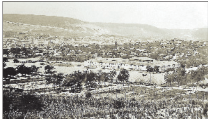
XX. yüzyılın başlarında Şumnu'yu gösteren bir fotoğraf

Tamamen tahrip edilen şehir bir daha inşa edilmedi. 1444 yılından sonra daha mütevazî bir yerleşim eski sitenin aşağısında Bokluca çayının dar vadilerinde yayılmaya başladı. 884 (1479) tarihli tahrir icmal kayıtları (Sofya Millî Ktp., O. A. K., nr. 45/29) şehrin nüfusu hakkında bilgi veren ilk kaynaktır. Buna göre şehirde yetmiş dört hıristiyan, on bir müslüman hânnesi (% 18) mevcuttu. Toplam nüfus 400-450 civarına ulaşıyordu. 922 (1516) ve 931 (1525) tarihli mufassal tahrir defterleri Kuzey Bulgaristan'daki Türk yerleşiminin hangi boyutlarda olduğunu açıkça göstermektedir. 1516'da Şumnu'da hıristiyanların 107 hânneye ulaştığı bir dönemde müslümanların hâne sayısı doksan dördtü. Artık kendini toparlayan şehrin müslüman nüfus oranı % 47'ye varmıştı. 1525'te denge müslümanlar lehine % 53 olarak değişti. 962 (1555) yılına kadar aradan geçen otuz yıllık süre zarfında Şumnu tam anlamıyla büyüdü ve şehir özelliği kazandı. 252 müslüman ve 152 hıristiyan hânnesiyle birlikte % 62'si müslüman yaklaşık 2000 kişilik bir nüfusa sahip oldu. Müslüman nüfusun çok az bir bölümü Hıristiyanlık'tan dönme idi. Nitekim mühtediler