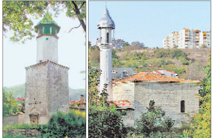
Şumnu Saat Kulesi ile Tatar Camii (Rifat Paşa Camii) – Bulgaristan