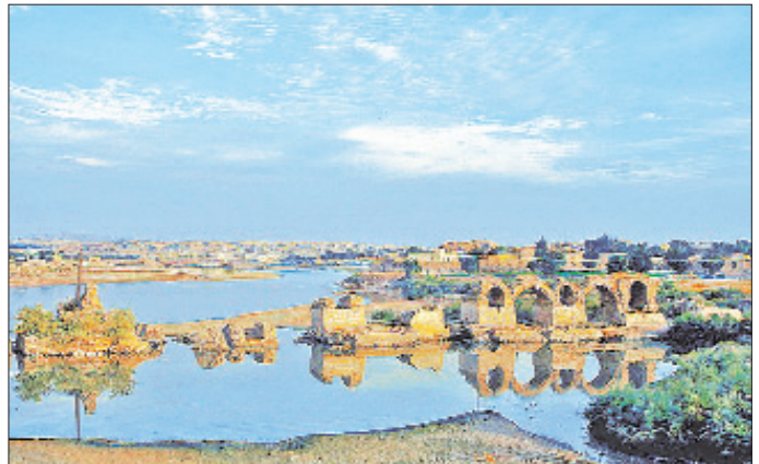
Şüşter'in tarihî Sadırvan Köprüsü

Çocukluk döneminde babasından ve Abdürrahîm eş-Şüşterî'den ders alan Şüşterî 979'da (1571) ilim tahsili için Meşhed'e gitti. Burada on yılı aşkın bir süre Abdülvâhid b. Ali et-Tüsterî ve diğer âlimlerin derslerini takip etti. Şehirde meydana gelen karışıklıklar yüzünden 990 Şevvalinde (Kasım 1582) Hindistan'a geçerek Bâbürlü Hükümdarı Ekber Şah'ın hizmetine girdi. Ekber Şah kendisine kazaskerlik ve vezirlik görevleri verdi. Oğlu Alâülmülk Muhammed Ali'nin kaydettiği bilgiye karşılık ( eş-Şavârimü'l-mührika , neşreden in giriş, s. y-b) Sünnî müelliflerin kitaplarında bu konuda farklı rivayetler bulunmaktadır. Mahallî Hindistan kaynaklarından faydalandığı anlaşılan Abdülhay el-Hasenî'nin naklettiğine göre Şüşterî önce tabip Ebü'l-