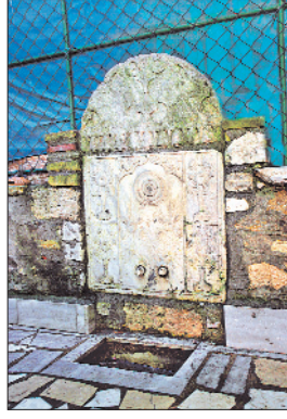
Tâhir Ağa Tekkesi avlusundaki çeşmelerden biri

zeme öğeleriyle tekkenin inşa edildiği dönemin özelliklerini yansıtır.