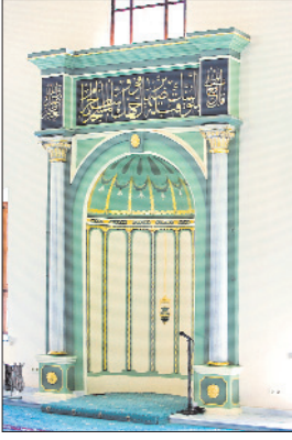
Tâhir Efendi Camii'nin mihrabı

lunur. Minber ve vaaz kürsüsü ahşaptır. Sivri bir külâha sahip olan minberin kapısı çanaktan çıkan kenger yapraklarıyla bezemiştir. Alt kattaki mahfile harim kapısının sağındaki merdivenle inilir. Mahfilde asılı duran, "Yâ Hazret-i Bilâl-i Habeşî" yazılı 1242 (1826-27) tarihli panonun sol alt köşesinde Tâhir Efendi'nin ketebe kaydı ile imzası bir istif halinde verilmiştir. Caminin kasetli ahşap tavanının göbeğinde altı kollu yıldız biçimi bulunmaktadır. Yapının meylli çatısının üzeri alaturka kiremitle örtülmüştür. Tek şerefeli, ince gövdeli minaresi alemine doğru ucu uzun bir şekilde sivriltilmiş boğumlu bir külâhla sonlanmaktadır.