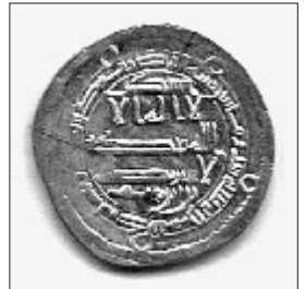
Bir yüzünde Herat Valisi Şükr b. İbrâhim, diğer yüzünde Tâhir b. Hüseyin'in lakabı olan "Zü'l-yemîneyn" yazıları olan 206'da (821) Herat'ta basılmış dirhem

Tâhir b. Hüseyin'in önderliğinde kazanılan zafer, Mâverâünnehir'in de idarî açıdan dahil bulunduğu Horasan bölgesinin Abbâsî Devleti içindeki nüfuzunu bir kat daha arttırdı. Bu ise Araplar karşısında Arap olmayanları temsil eden müslüman Horasan halkının Emevîler'in yıkılışından sonra kazandığı en büyük zaferdi. Bu zaferle Türk ve İranlılar, Araplar karşısındaki üstünlüklerini iyice pekiştirip devlet yönetimindeki yerlerini sağlamıştı. Tâhir b. Hüseyin'in devlet içinde daha fazla öne çıkmasını istemeyen Me'mûn'un veziri Fazl b. Sehl onun büyük nüfuz kazandığı Fars, Ahvaz, Basra ve Kûfe yerine 198 (814) yılında merkezi Rakka olan el-Cezîre, Suriye, Mısır ve Mağrib'i içine alan bölgeye vali tayin edilmesini sağladı. Tâhir b. Hüseyin, Rakka valiliği döneminde el-Cezîre bölgesinde ayaklanan Nasr b. Şebes el-Ukaylî ile altı yıl mücadele etti. Öte yandan Ömer b. Hallâl ve Ebû Abdurrahman es-Süffî'nin Mısır'da çıkardığı karışıklıklarla uğraşmak zorunda kaldı. Fakat hiçbirinde -belki de isteksizliğinden dolayı- yeterince başarı sağlayamadı, daha çok mevcut durumu korumaya çalıştı. Veziri Fazl b. Sehl'e güveni zayıflayan Me'mûn, 204'te (819) Tâhir b. Hüseyin'i Bağdat sâhibü's-şurtalığına getirdi. Oğlu Abdullah ise babasının yerinde Rakka'da göreve devam etti. Tâhir b. Hüseyin, çok geçmeden Halife Me'mûn tarafından ortadan kaldırılacağı en-