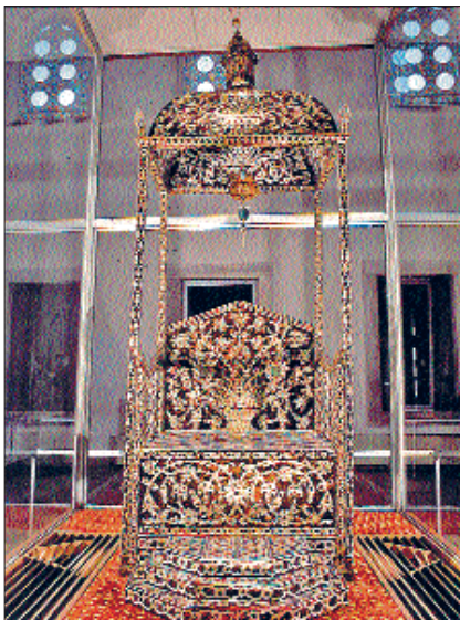
Sultan I. Ahmed'in ceviz üzerine bağa ve sedef kakma tahtı (TSM, Envanter nr. 2/1652)

Osmanlılar'da cülûs merasimi padişahın öldüğü yerde veya başşehirde yapılırdı. Topkapı Sarayı'nda Bâbüssaâde önüne kurulan tahta oturan şehzade resmen padişahlığını ilân ederdi. Cülûs merasimi esnasında tahtın sağında ve solunda iki üç kişiden oluşan has odalılar bulunurdu. Dîvân-ı Hümâyün toplantılarından sonra padişahın izniyle Arz Odası'na girilir, bu sırada padişah tahtta otururken içeri girenleri karşılardı. Padişah serdarlığa tayin edilen vezir ve paşaları Arz Odası'nda taht üzerinde kabul ederdi. Padişahlar sefere çıktıklarında tahtlarını birlikte götürür, taht arz çadırında kurulurdu. Kanûnî Sultan Süleyman 1532'de Macaristan seferi sırasında Habsburg İmparatoru I. Ferdinand'ın elçilerini arz çadırında altın bir taht üzerinde kabul etmişti. Surre-i hümâyunun gönderilmesi esnasında da padişahın tah-