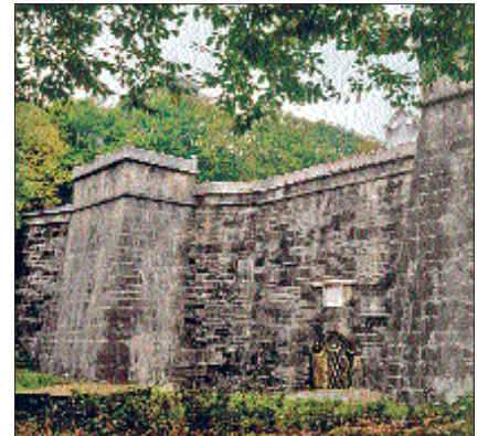
Taksim Suyu tesislerinden Vâlide Bendi – Bahçeköy

Fâtih Sultan Mehmed'den sonraki devirlerde Haliç'in kuzeyindeki bölgenin su ihtiyacı küçük menbalardan beslenen çeşmelerden ve bazı isâlelerden karşılanıyordu. Galata Mevlevîhânesi'nin suyunu temin eden ve Levent Çiftliği'ndeki iki menbadan beslenen isâle hattı, Kasımpaşa'nın suyunu sağlayan isâle hattı ve Kâğıthane menba suyunu getiren isâle hattı bu bölgedeki isâlelerin en önemlilerindendi. Boğaz kıyılarında inşa edilen yeni köşkler