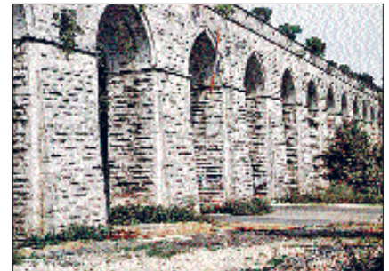
Bahçeköy'de I. Mahmud Kemerini

Taksim tesislerinin bugün Hacıosmanbayırı'ndaki filtreden sonraki yolları tamamen haraptır. Taksim tesislerinin ana hat üzerindeki önemli yapıları şunlardır: 1. Harbiye Maksemi. Bugün mevcut olmayan bu maksemin etrafı kâgir duvarlarla çevrili ve üstü basık bir kubbe ile örtülü idi. Planda maksemin içten içe boyutları 3, 05 × 4,50 m. ve yüksekliği 2,30 metredir. Zemini mermer kaplıdır. Üzerinde III. Selim'in tuğrası ve 1212 (1797-98) tarihini veren dört sattrılık kitâbe mevcuttur. 2. Taksim Haznesi. Taksim Meydanı'nda bulunan bu yıkık haznenin dış boyutları 17 × 90 metredir. İçerisi on iki çift gözden oluşur. Gözlerin iç boyutları 6,21 × 6,21 metredir. Bu duruma göre haznenin faydalı hacmi 2730 m 3 tür. 3. Taksim Maksemi. İstiklâl caddesinin Tak-